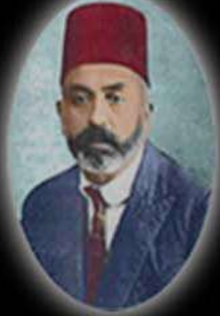
Mehmet Akif ERSOY

Dalgalar sen de şafaklar gibi ey şanlı hilâl! Olsun artık dökülen kanlarımın hepsi helâl. Ebediyen sana yok, ırkıma yok izmihlâl: HHakkıdır, hür yaşamış, bayrağımın hürriyet; Hakkıdır, Hakk'a tapan, milletimin istiklâl