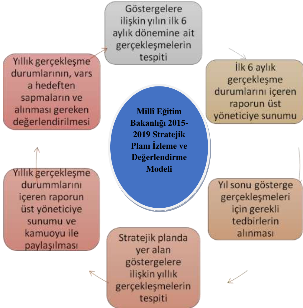
Şekil :Sabri Taşkın ilkokulu 2015-2019 Stratejik Planı İzleme ve Değerlendirme Modeli